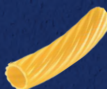
TORTIGLIONI N°83 CODICE PRODOTTO: 022430 TEMPO DI COTTURA: 12 MINUTI