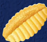
GNOCCHETTI SARDI CODICE PRODOTTO: 600060 TEMPO DI COTTURA: 14 MINUTI