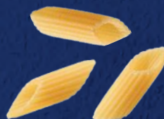
MEZZE PENNE RIGATE N°70 CODICE PRODOTTO: 022411 TEMPO DI COTTURA: 11 MINUTI