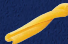
CASARECCE SICILIANE CODICE PRODOTTO: 022412 TEMPO DI COTTURA: 12 MINUTI