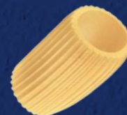
MEZZE MANICHE RIGATE N°84 CODICE PRODOTTO: 600084 TEMPO DI COTTURA: 12 MINUTI