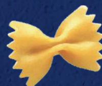
FARFALLE N°265 CODICE PRODOTTO: 022432 TEMPO DI COTTURA: 12 MINUTI