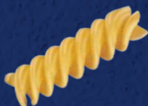
FUSILLI N°98 CODICE PRODOTTO 1 KG: 022427 CODICE PRODOTTO 3 KG: 001819 TEMPO DI COTTURA: 11 MINUTI