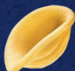
ORECCHIETTE PUGLIESI CODICE PRODOTTO: 600056 TEMPO DI COTTURA: 12 MINUTI