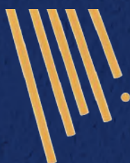
SPAGHETTONI N°7 CODICE PRODOTTO: 328007 TEMPO DI COTTURA: 11 MINUTI