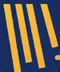
LINGUINE N°13 CODICE PRODOTTO: 328013 TEMPO DI COTTURA: 10 MINUTI