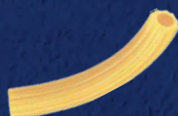
SEDANINI N°53 CODICE PRODOTTO: 600053 TEMPO DI COTTURA: 12 MINUTI