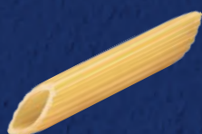
PENNETTE RIGATE N°72 CODICE PRODOTTO 1 KG: 022426 CODICE PRODOTTO 3 KG: 001817 TEMPO DI COTTURA: 10 MINUTI