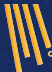
BUCATINI N°9 CODICE PRODOTTO: 328009 TEMPO DI COTTURA: 8 MINUTI