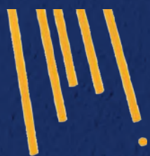
SPAGHETTI N°5 CODICE PRODOTTO 1 KG: 328005 CODICE PRODOTTO 3 KG: 001816 TEMPO DI COTTURA: 9 MINUTI